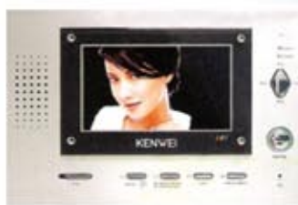
KW - U 123C