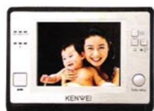
KW - U 730C