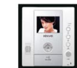
KW - U 125C