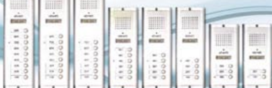
KW - 135 MC/M (Series)